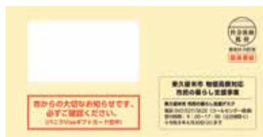
同カード配付時の封筒

■職員などを装った不審電話や詐欺等にご注意ください 本事業に関する内容で、市役所からカード番号や銀行口座情報をお聞きすることや、ATMでの操作を依頼することはありません。不審な連絡があった際にはすぐに警察署へ通報してください。