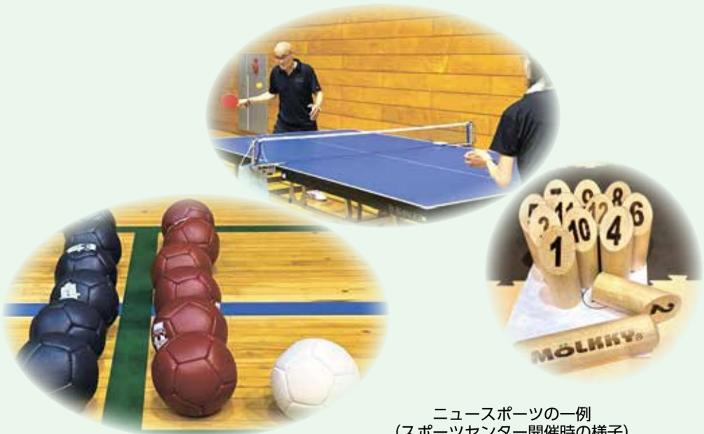
ニュースポーツの一例 (スポーツセンター開催時の様子)