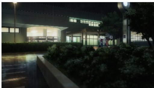
『瑠璃の宝石』 渋谷圭一郎／著 KADOKAWA