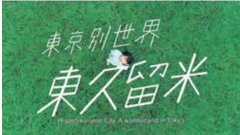
東久留米市プロモーション動画