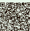
「ときめき」に関する市HP(バックナンバーなど)