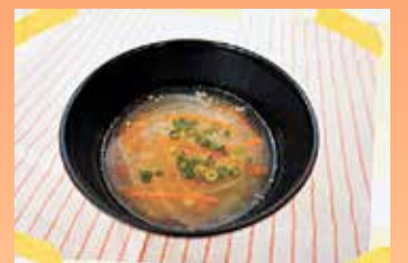
しおかるくるめスープより 「新玉ねぎのスープ」