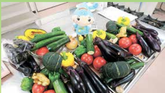
地場野菜とるるめちゃん