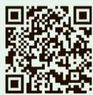
ときめき編集委員募集に関する市HP