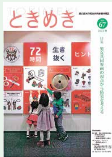
「ときめき」第67号(2022春)の表紙