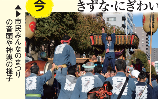
今 ▲市民みんなのまつりの音頭や神輿の様子