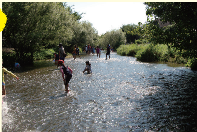
憩い ▲落合川(浅間町二丁目) 昭和44年(1969年)

畑が広がっていた東久留米駅の西側にも、平成6年には東久留米駅西口が完成し、段々と現在の風景に近づいてきました。毎年11月には市民みんなのまつりが開催され、多くの人で賑わいます。また、東久留米市には武蔵野の自然が色濃く残っており、貴重な清流と湧水群が身近にあります。昔も今も、人々にはぎわい、水辺は憩いの時間を与えてくれています。