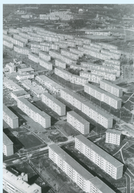
▲滝山団地・久留米西団地 昭和44年(1969年)

昭和31年(1956年)に町制が施行され、30年代後半から、ひばりが丘団地・東久留米団地・滝山団地・久留米西団地などが次々と建設され、人口は急激に増加しました。特に昭和35年(1960年)に約1万9000人だった人口は、昭和45年(1970年)には約7万8000人となり4・1倍の増加を記録し、日本で最も人口の多い町となりました。そして、昭和45年(1970年)10月1日に東京都で25番目の市として「東久留米市」が誕生しました。