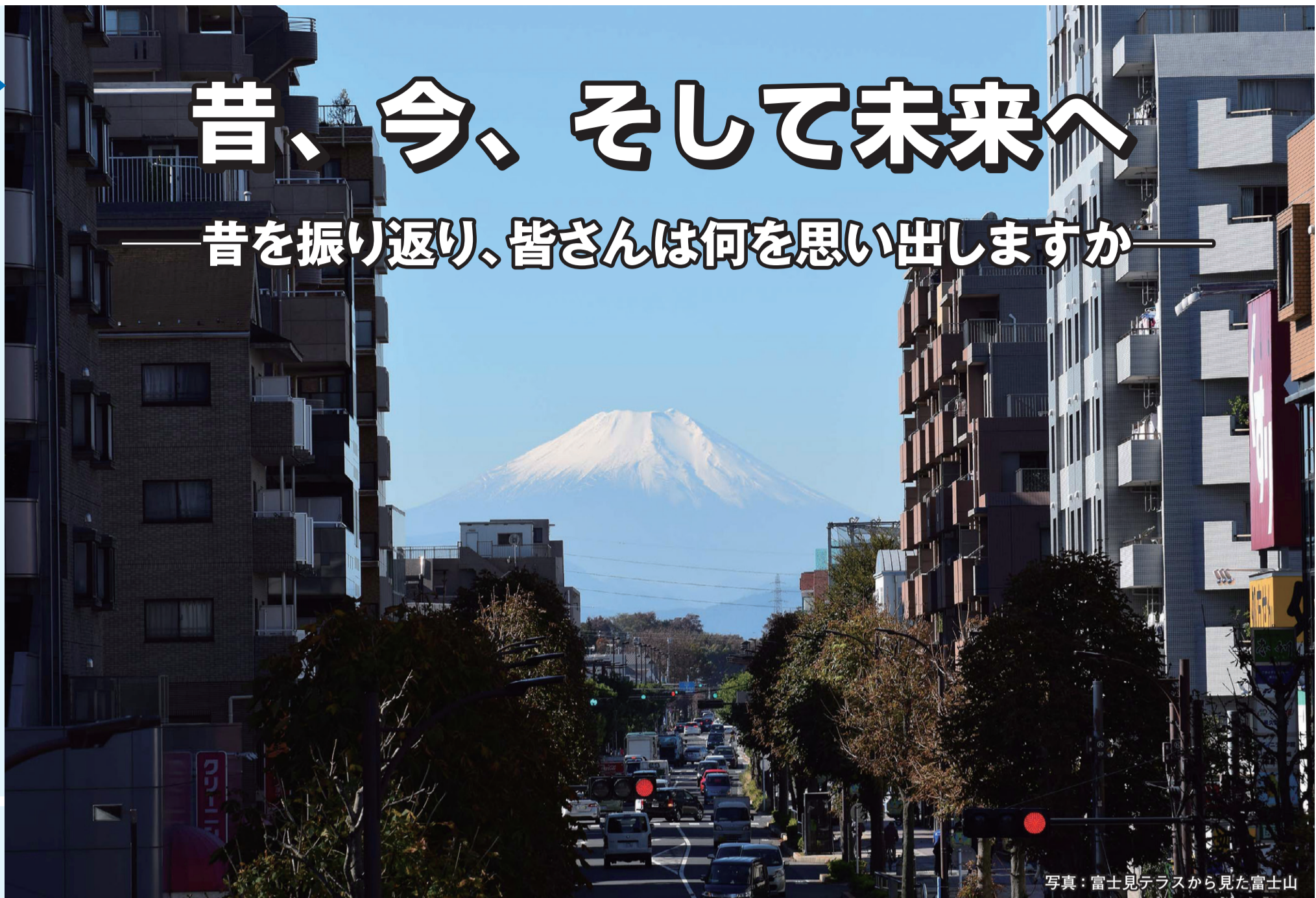
写真:富士見テラスから見た富士山