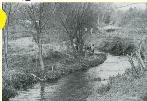
▲落合川(浅間町二丁目) 昭和44年(1969年)