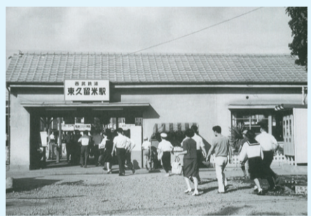
▲東久留米駅駅舎 昭和44年(1969年)

明治22年(1889)に久留米村が誕生しましたが、その名称は市内を流れる「久留米川(現在の黒目川)」から付けられたというのが一般的なお説です。現在の黒目川は、江戸時代の文献や石碑に「久留目川」・「来目川」・「来梅川」と書かれており、明治政府が編纂した『皇国地誌』には「久留米川」と記されています。このように、普段親しまれていた川の名前が村名になるほど東久留米は水の豊かな場所なのです。昭和45年(1970年)に市制が施行されますが、福岡県久留米市と行政的な混同を避けるためや、当時の町民から親しまれていた駅名の「東久留米」を希望する声も多く、現在の市名が決定しました。